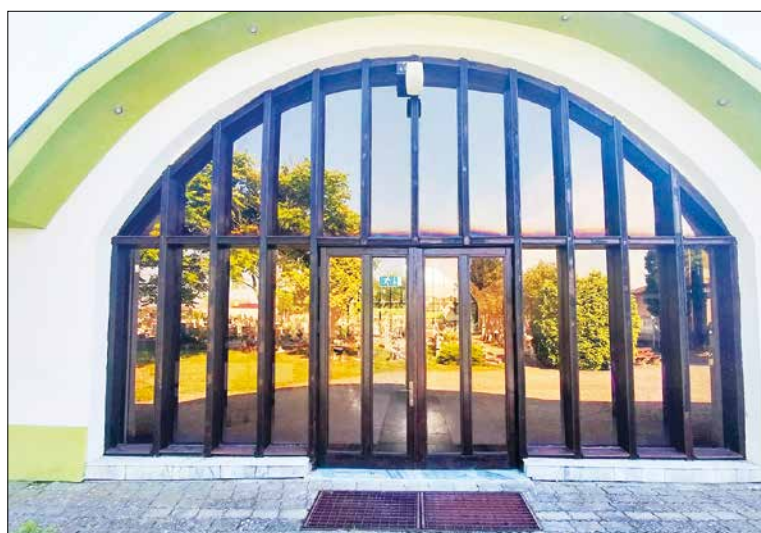
Rekonštrukcia drevených výplní Domu smútku znovu umožnila, aby obec mala dôstojné miesto na poslednú rozlúčku s našimi najdrahšími.