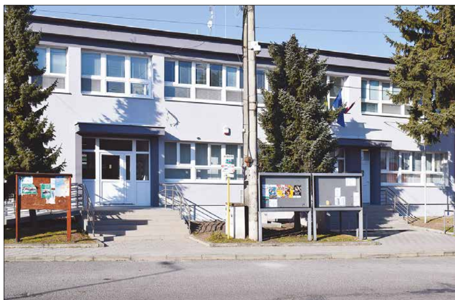
Uskutočnené zateplenie budovy obecného úradu ušetrí nemalé prostriedky za energie, ktoré môže obec lepšie využiť v prospech svojich obyvateľov.