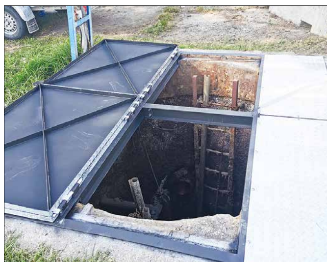
Havarijný stav hlavnej prečerpávacej stanice sa vyriešil formou komplexnej rekonštrukcie (nové výkonné čerpaadlo, obnova šachty, nové poklapy).