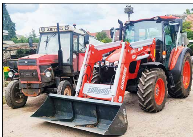
Vyprázdňovanie žúmp je stále povinnosť mnohých obyvateľov Lábu. Obec sa nezaobíde bez kvalitného traktora, ktorý sa podarilo zabezpečiť. Na obrázku je aj pôvodný traktor, s ktorým sa uskutočňovalo v predošlom volebnom období odsávanie zo žúmp. Na začiatku funkčného obdobia súčasného zastupiteľstva bol bez platnej technickej kontroly a v dezolátnom stave. Dnes je v dielni, kde aj z neho bude funkčný a spoľahlivý stroj. Fotografie motorovej kosačky, ktorú obec zakúpila, už sme uverejnili. Do motorového parku v tomto roku pribudne aj malotraktor s príslušenstvom.