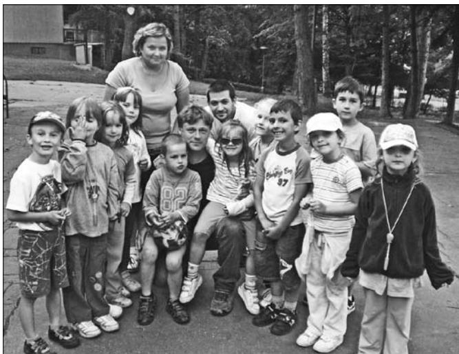
Od 15. do 19. 6. 2009 sme boli v Zlatníckej doline pri Skalici v Škole prírody a bolo nám tak super! Neverili by ste, koľko krásy je tam pokoje, čo sme nestihli tento rok, to dobeh- neme o rok – už sa tešíme...