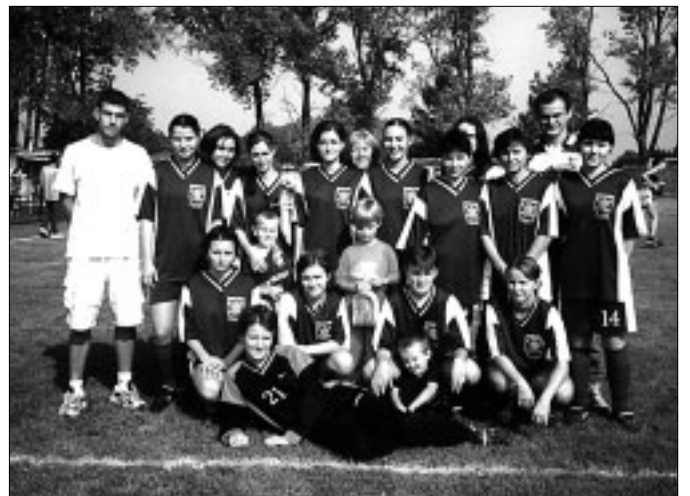
Družstvo dievčat z Dolných Salíb