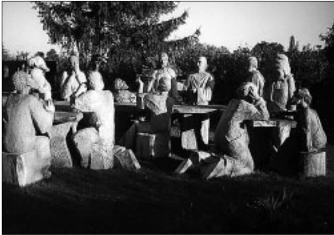
Posledná večera Pána