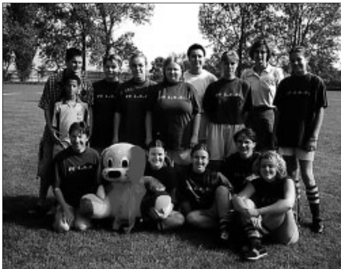
Trojnásobné víťazky turnaja - dievčatá z Lábu s darčekom