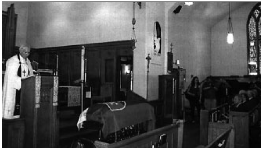
Potomkovia amerických Slovákov sa v evanjelickom kostole Trinity Luthers Church rozlúčili s Dr. Milanom Hodžom - prvým Slovákom, ktorý zastával funkciu predsedu vlády.

Medzipristátie sa konalo na Islande, kde sme po načerpaní pohonných hmôt pokračovali smerom na americký kontinent a po 13. hodinách celkového letu sme o 18. hodine miestneho času v teplote 40 °C pristáli na letisku v Chicagu. Pretože sa nás ako vládnej delegácie netýkali letecké a colné formality (to všetko sa udialo už na medzipristátí v Rejkjavíku na Islande v lietadle), asi po hodine cesty autobusom (mimochodom: v autobuse sa pokazila automatická prevodovka a zatiaľ, čo okolo nás autá frčali v štvorprúde, my sme išli