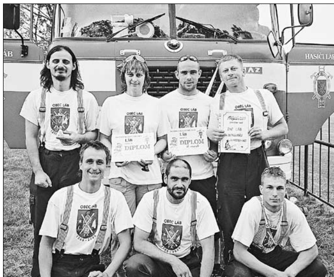
Sedem statočných po úspešnom „požiarnom útoku“. Keďže už v názve majú naši hasiči prívlastok DOBROVOĽNÍ, zaslúžia si našu úctu. Dúfajme, že aj napriek pravidelnému zdokonaľovaniu svojho majstrovstva ho v praxi nebudú v tomto roku musieť uplatniť.