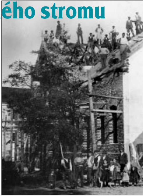
Vchod do jednoposchodovej budovy, výstavba Malinovských domu

Vedľa poschodovej budovy pri hlavnej ceste bol obchod so zmliešaným tovarom, výkupňa mlieka a ľadovňa, drevená brána, stodola a vo dvore hospodárske budovy. Mali kone aj kravy. Vo dvore bola aj pekáreň. Vchod do nej bol zhora, vedľa bývalého kina. Ako pekár tam naposledy pracoval