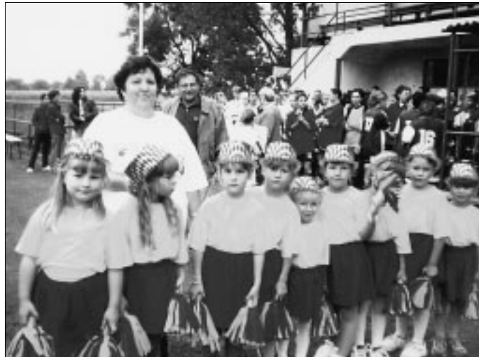
Úspešné malé roztleskavačky

Cestou našich obecných novín sa chcem poďakovať rodičom za spoluprácu a, samozrejme, sponzorom, ktorí nám v uplynulom školskom roku pomohli: