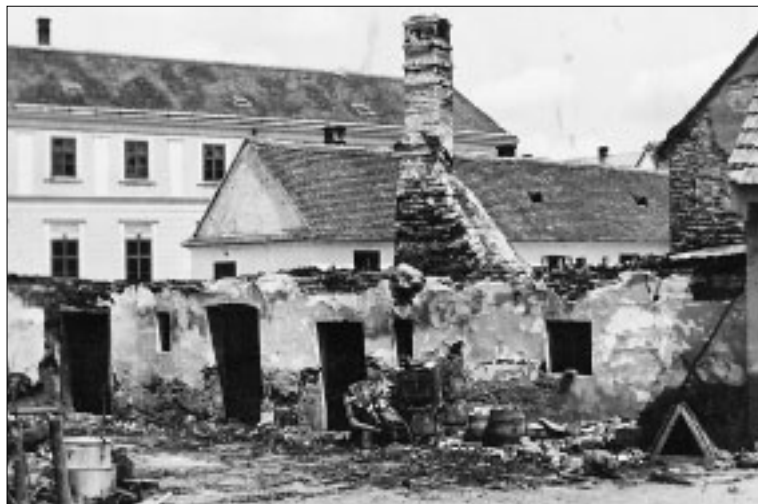
Jednoposchodová budova zboku, lábska pastiera