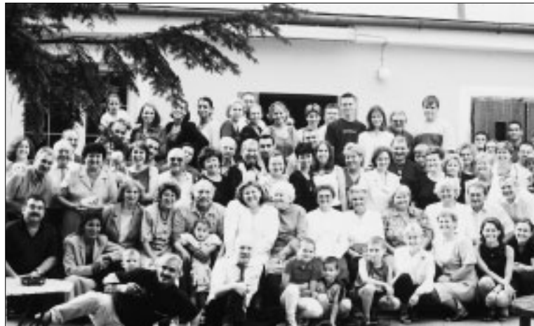
Stretnutie v Lábe