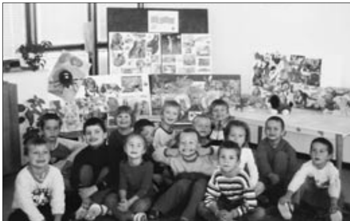
Výstava ku Dňu zvierat