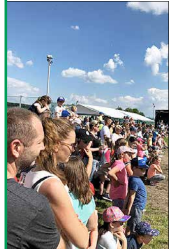
Pokračovanie na 3. strane